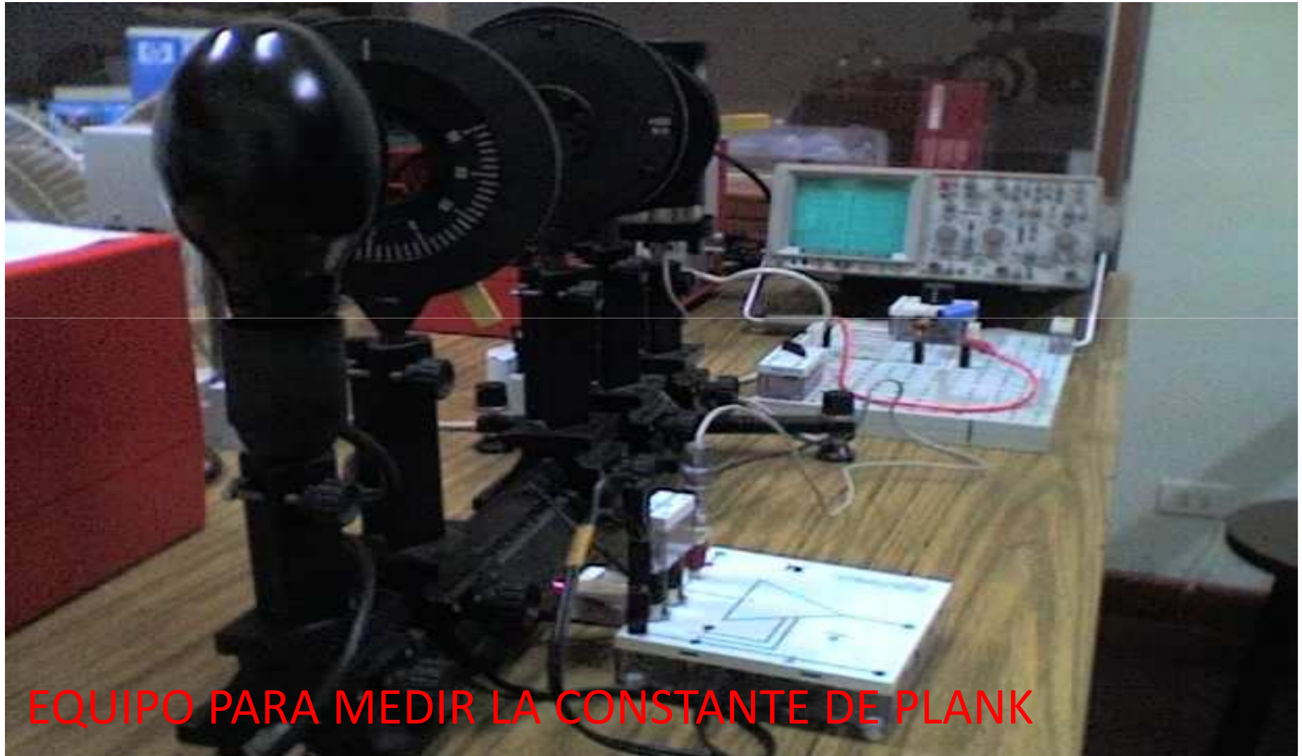
EQUIPO PARA MEDIR LA CONSTANTE DE PLANK