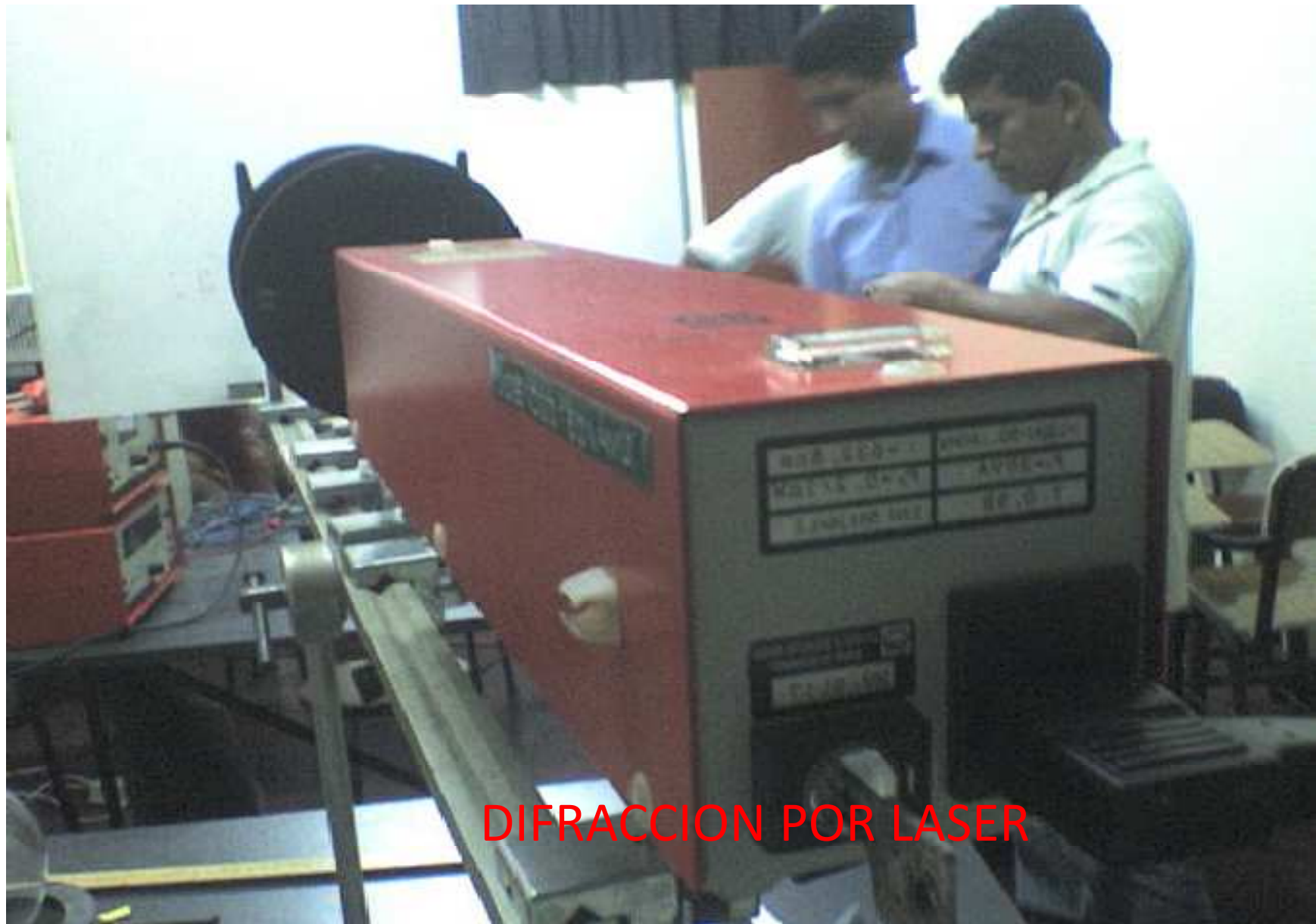
DIFRACCION POR LASER